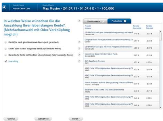
Beispielfrage in der Listenansicht.

Der Auswahlprozess mit ITA SELECT in der Listenansicht: